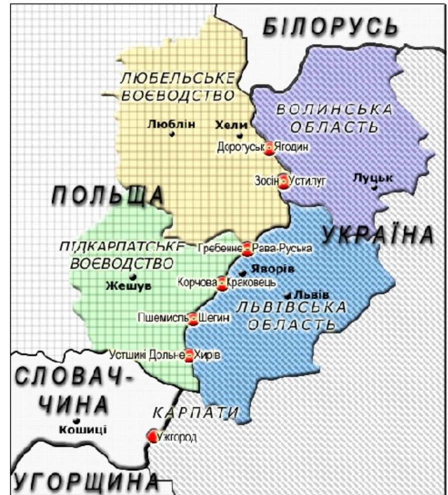
Додаток 8 Українсько-польський транскордонний регіон

Для прийняття обґрунтованих рішень щодо вибору об'єктів та послідовності їх передачі у концесію, вивільнення частини бюджетних коштів і перерозподіл статей їх використання тощо, необхідно провести ряд пошуково-дослідних робіт, підготувати відповідну техніко-економічну та тендерну документацію.